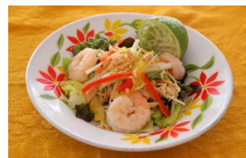
ソムタム：青パパイヤを使用したタイ料理