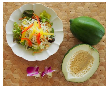
<盛り付け例と青パパイヤ>

“青パパイヤ”は、南国フルーツとして知られているパパイヤを、未熟な緑色の状態で収穫したものです。東南アジアや沖縄などでは、野菜として調理されており、シャキシャキとした食感とほのかな甘みが特長です。