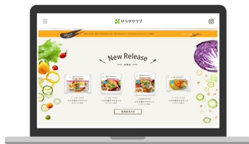
<画面表示イメージ>