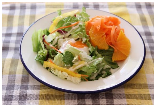
「オレンジキャロットラペのサラダ」