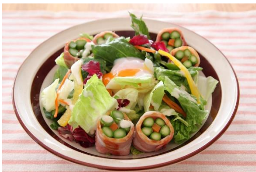
「アスパラ人参巻きのシーザーサラダ」