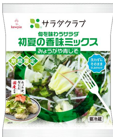
＜旬を味わうサラダ 初夏の香味ミックス みょうがや青じそ＞

株式会社サラダクラブ（代表取締役社長：新谷昭人、本社：東京都調布市）は、みょうがを使用した「旬を味わうサラダ 初夏の香味ミックス みょうがや青じそ」（85g /税込 237円）を2026年5月15日（金）～6月30日（火）までの期間限定で販売します。