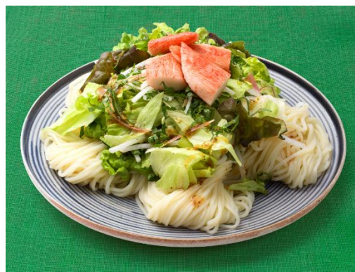
＜アレンジレシピ みょうがや青じそ香るシャキシャキサラダそうめん＞

「旬を味わうサラダ 初夏の香味ミックス みょうがや青じそ」は、季節を感じられる野菜を使用した「旬を味わうサラダ」シリーズの初夏限定の新商品です。